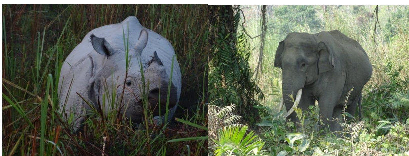
Rhinocéros unicolore indien et éléphant d'Asie (A. Gentric 2017)

Reptiles : 42 espèces recensées. Deux espèces de varans, le varan du Bengale et le varan malais sont présents, ainsi que quinze espèces de serpents dont le rare cobra à monocle. Le parc est riche en tortues : quinze espèces dont l'endémique Kachuga sylhetensis .