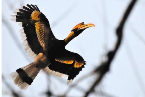
Calao bicorne

Journée entière consacrée à l'exploration de la splendide région de Mayudia et à la découverte de nouvelles espèces, oiseaux et mammifères, avec une pause déjeuner au Lodge.