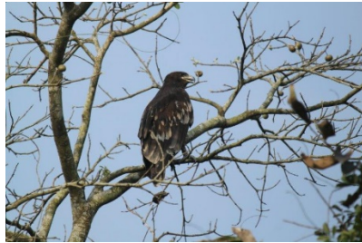
Aigle criard (P. de Grissac 2017)

Retour au camp Panijuri pour reprendre les véhicules et aller déjeuner à l'hôtel. Après le déjeuner de nouveau excursion en jeep dans le parc Kaziranga.