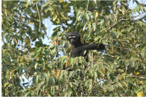
Gibbon Hoolock (P. de Grissac 2017)

Retour au camp Panijuri pour reprendre les véhicules et aller déjeuner à l'hôtel. Après le déjeuner de nouveau excursion en jeep dans le parc Kaziranga.