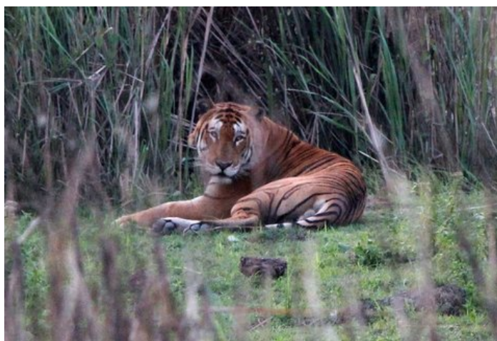
Tigre du Bengale