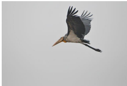
Marabout Argala M. Clément (2017)

En route, arrêt au « Garbage dump » pour voir le rassemblement de Marabout Argala/ Greater Adjutant Stork . Cette immense décharge à ciel ouvert nous rappelle aussi les conditions difficiles d'une partie de la population, ici obligée de fouiller les détritiques pour gagner de quoi manger.